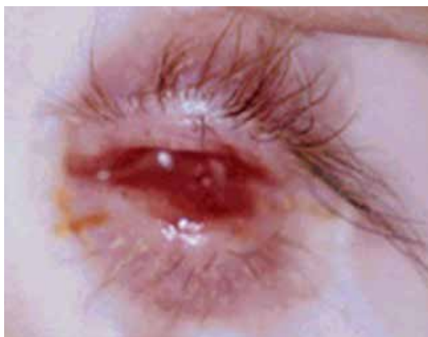
RYCINA 1. Wrodzony brak gałki ocznej.

Urazy okołoporodowe uszkadzające narząd wzroku zdarzają się najczęściej w trakcie porodów kleszczowych i z zastosowaniem próżniociągu. Stwierdza się je również u noworodków urodzonych z niską punktacją w skali Ap-