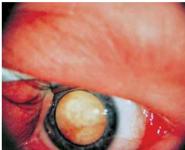
RYCINA 2. Leukokoria – widoczne masy guza.

Nerw wzrokowy, czyli II nerw czaszkowy, powstaje między 8 a 15 tygodniem ciąży, tworzą go wypustki nerwowe komórek zwojowych siatkówki. Jako wyraźnie ukształtowana struktura widoczny jest już w piątym miesiącu życia płodowego. W 18 tygodniu osiąga maksymalną (ok. 2,5 miliona) liczbę włókien nerwowych, w późniejszym czasie część z nich ulega apoptozie. Jest nerwem czuciowym i stanowi najbardziej wysuniętą część mózgowia. Włókna nerwu przewodzą bodźce wzrokowe i sięgają od siatkówki do ciała kolankowatego bocznego, przechodząc następnie w dalszy odcinek drogi wzrokowej. Już u płodu rozpoczyna się jego mielinizacja, która kończy się w okresie pourodzeniowym. Jeśli dojdzie do zadziałania czynników uszkodzających struktury nerwu w okresie płodowym, powoduje to zaburzenie jego rozwoju i w następstwie hipoplazję. Tarcza nerwu II ma wówczas często zbyt małą średnicę i zazwyczaj nieprawidłowy kształt.